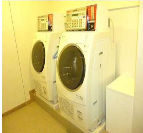
共同洗濯機イメージ