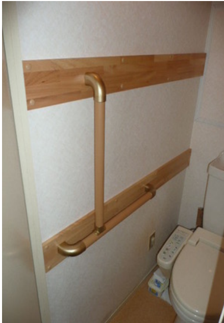
バリアフリーお手洗い