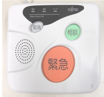
緊急呼び出しボタン