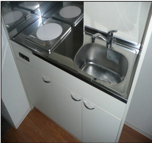
キッチンイメージ