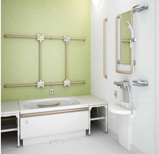
個別浴室イメージ