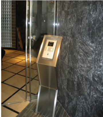
オートロック機能